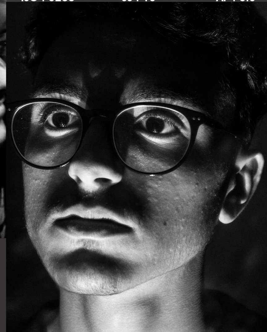
Home Studio 16/12/2018