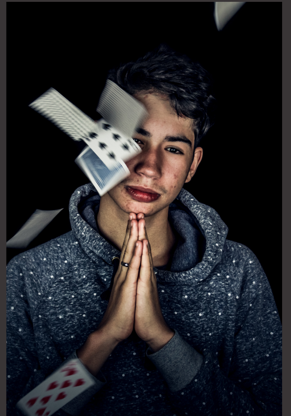
AVEC PHOTOSHOP + LIGHTROOM