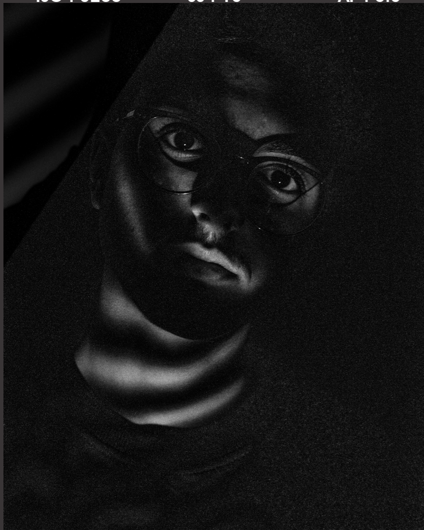
Home Studio 16/12/2018