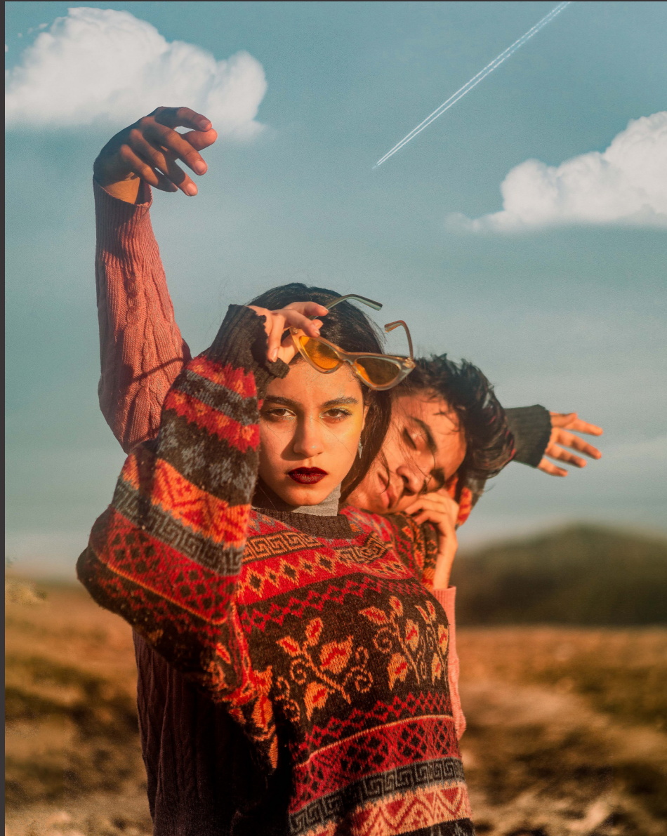
La Falaise 13/12/2019