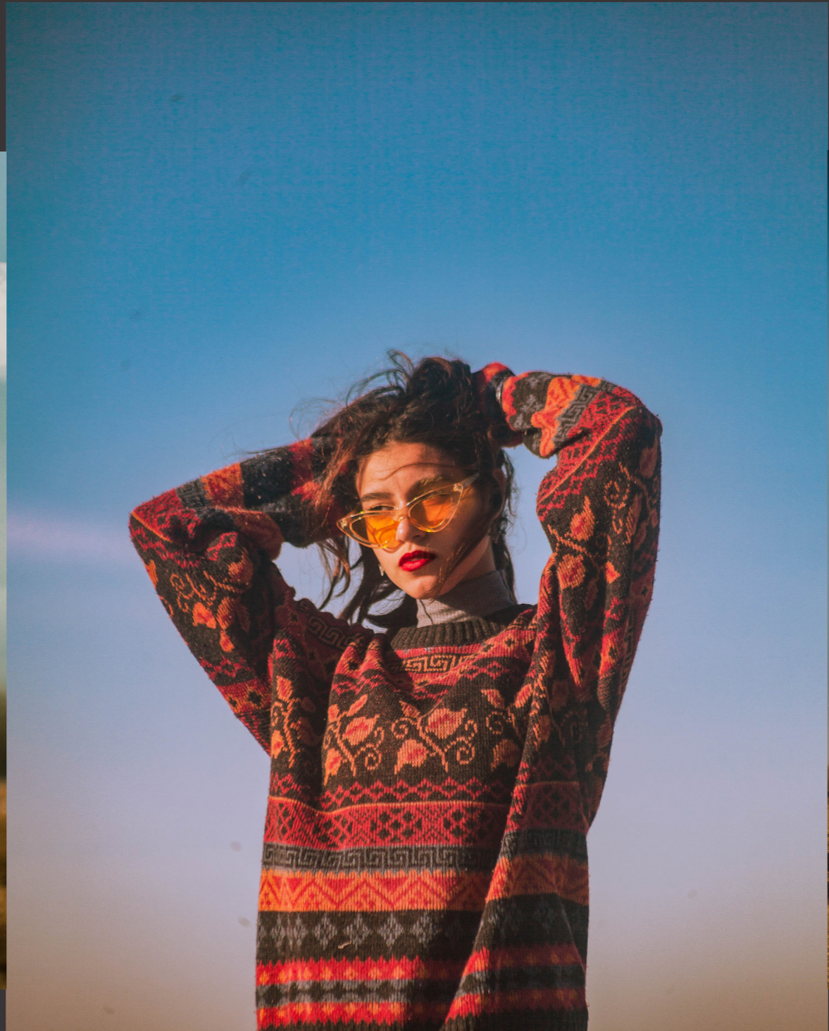
La Falaise 13/12/2019