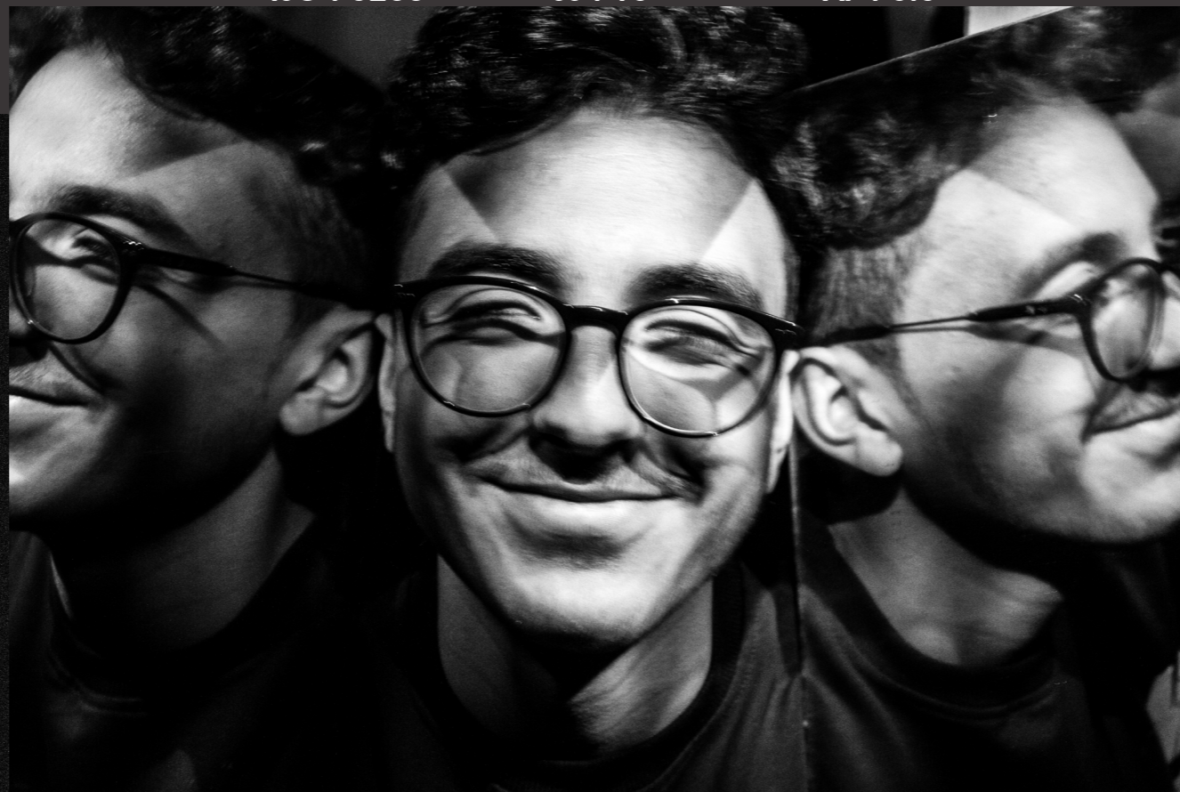
Home Studio 16/12/2018