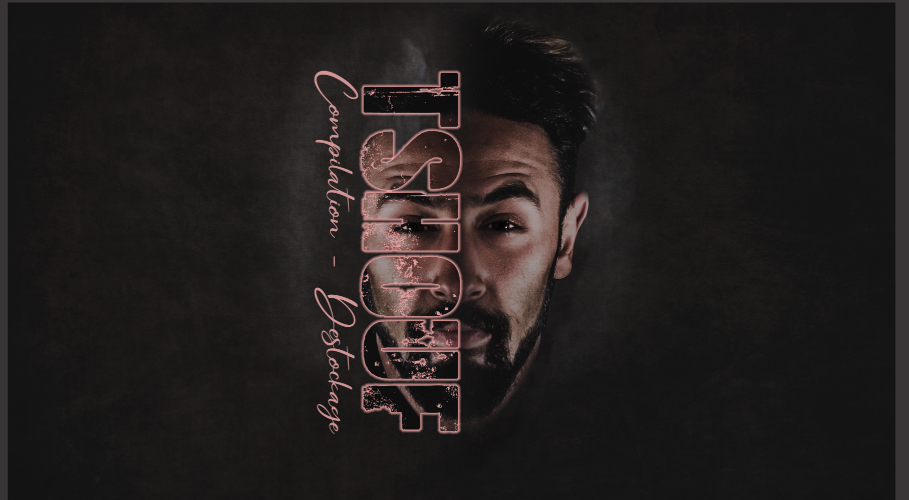
AVEC ILLUSTRATOR + PHOTOSHOP + LIGHTROOM