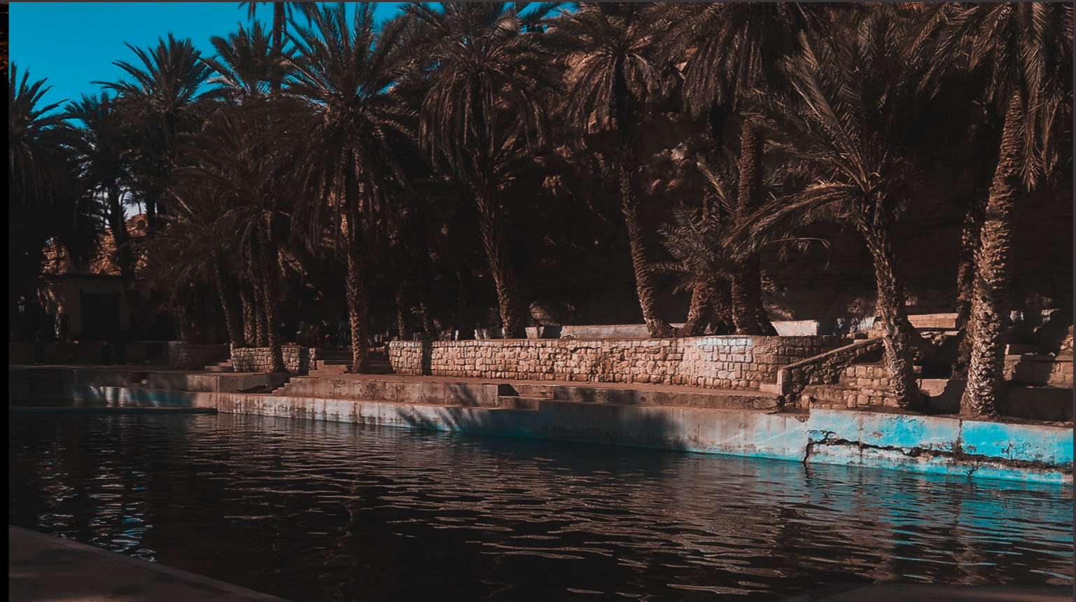
Meski - Errachidia 04/01/2019