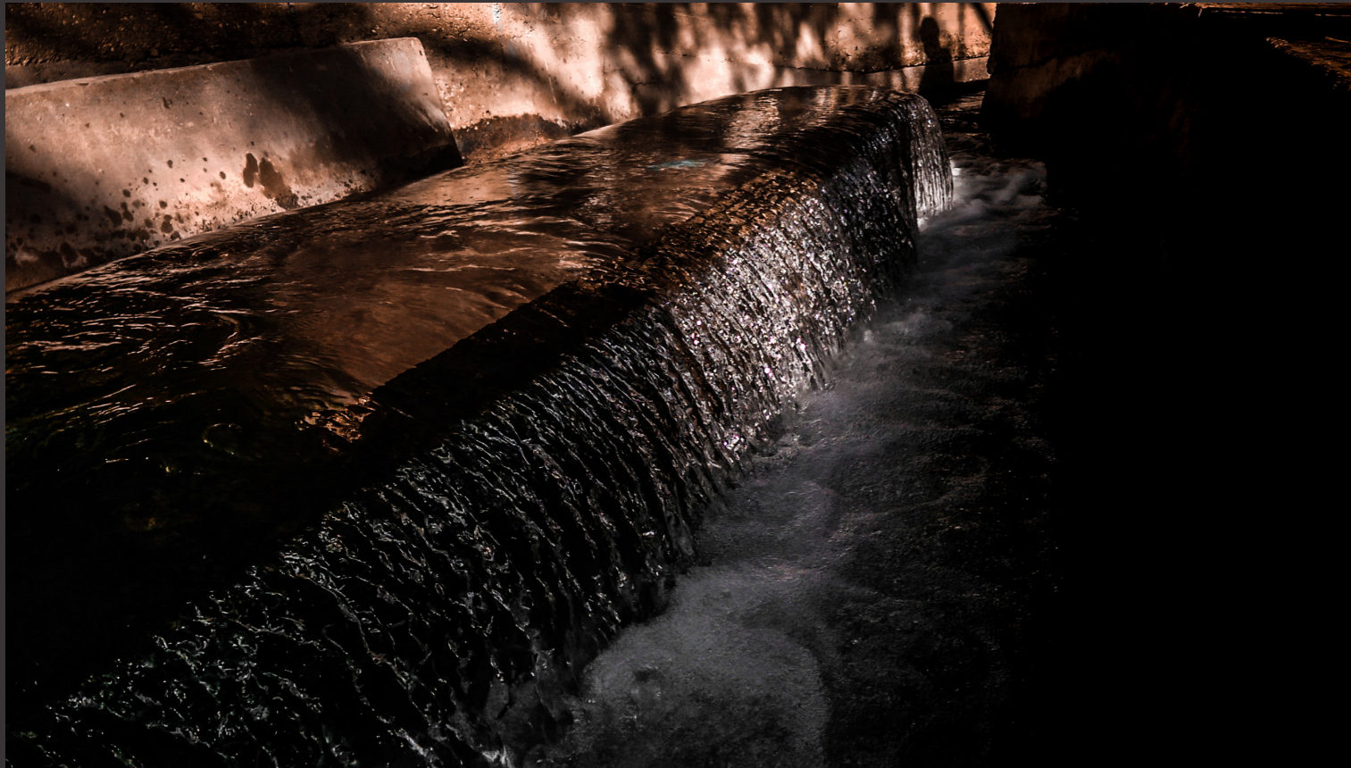
Meski - Errachidia 04/01/2019