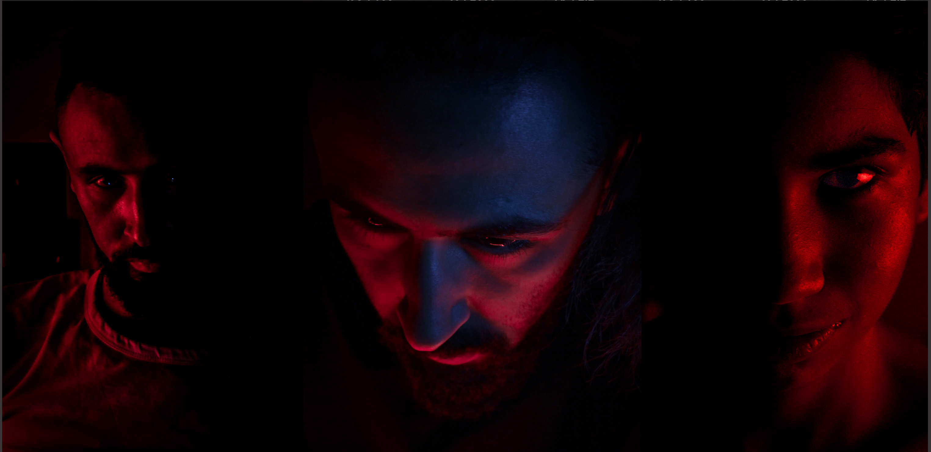
Home Studio 23/08/2018

ISO : 100 SS : 2000 AP : 2.2 ISO : 100 SS : 2000 AP : 2.2 ISO : 100 SS : 2000 AP : 2.2