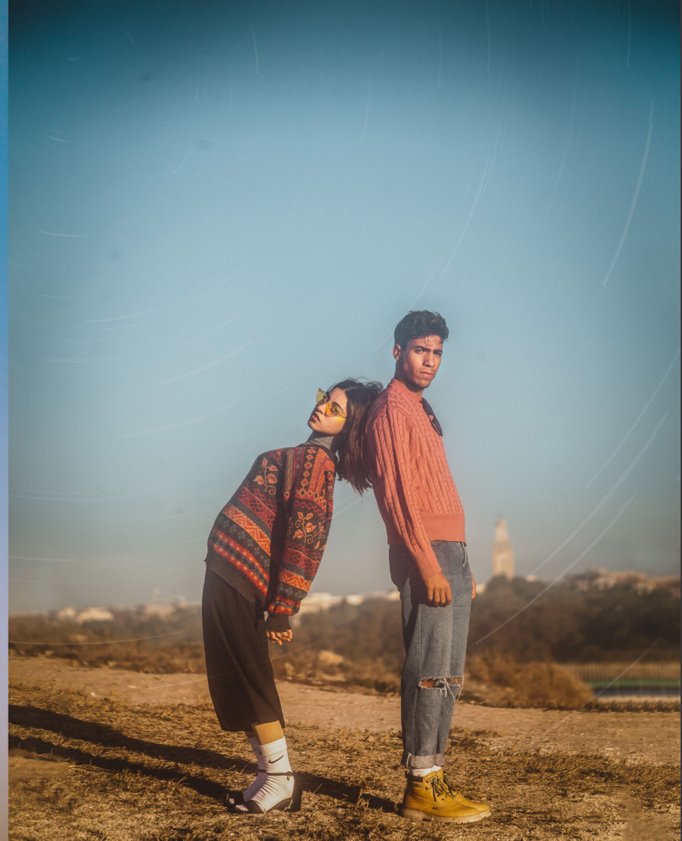
La Falaise 13/12/2019